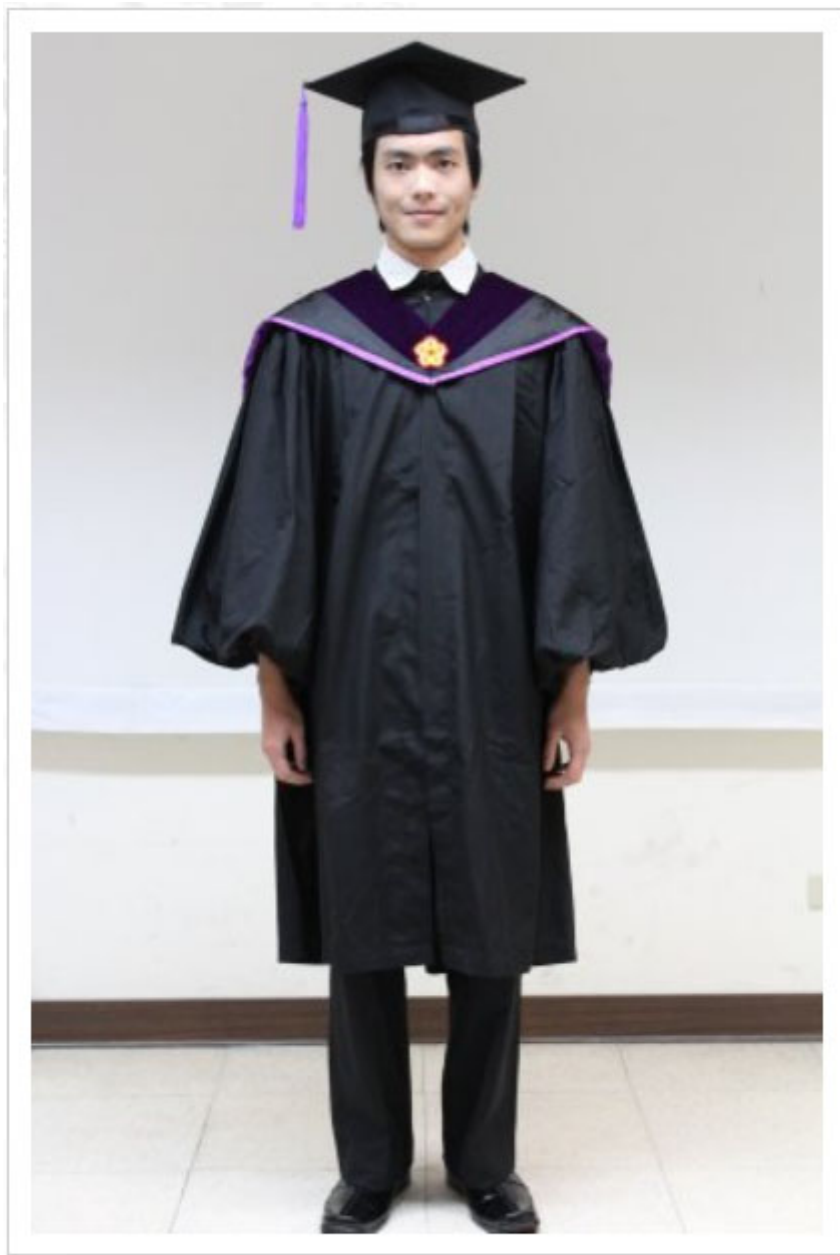
社科院、法學院、國務院